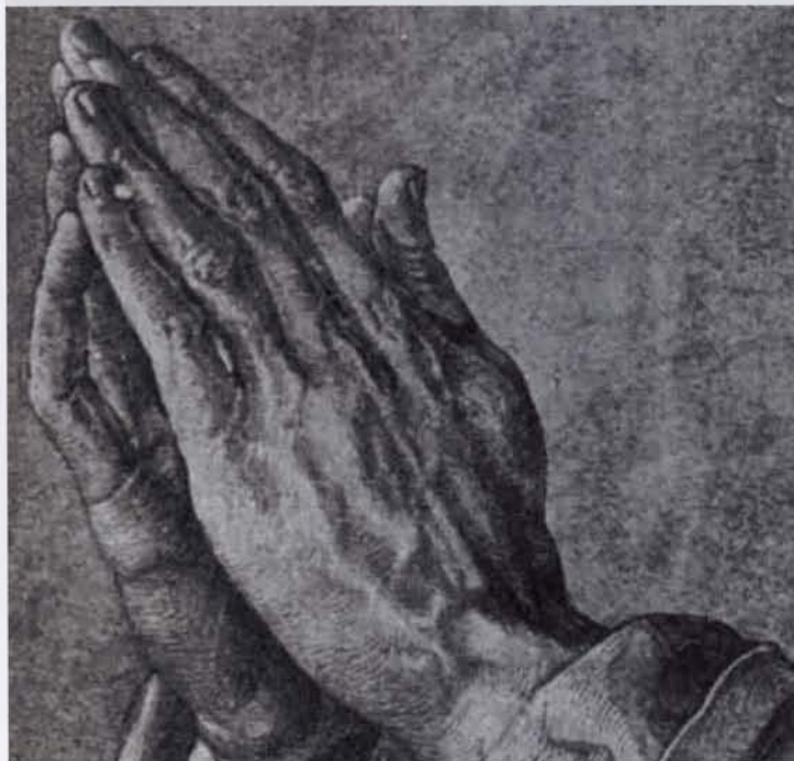
Biðjum Jerúsalem friðar. (Sálm; 122.6)