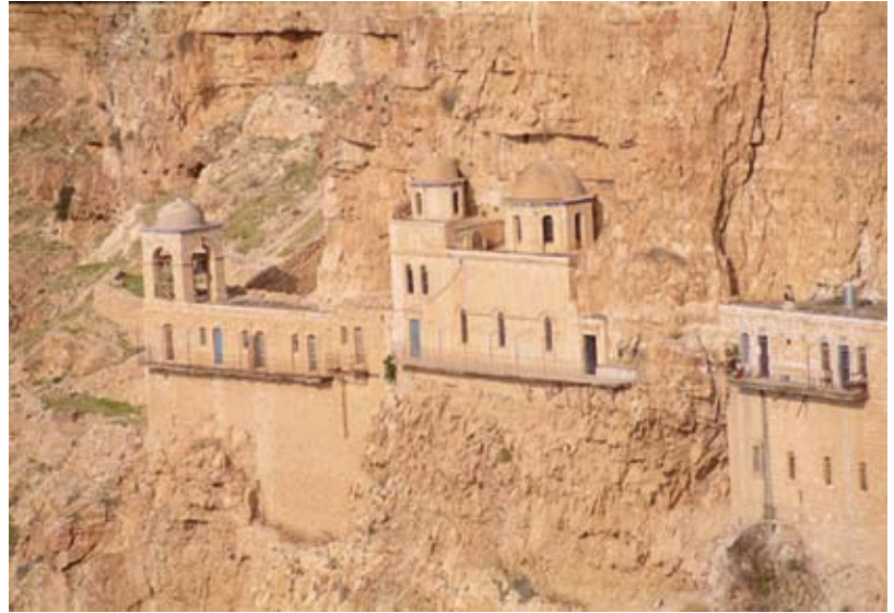
Klaustur í fjallshlíðum Ísraels